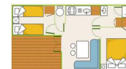
5 Mobil homes 32 m 2